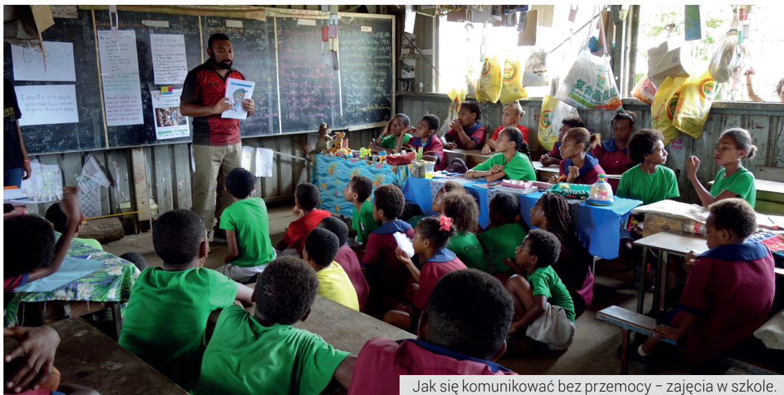
Jak się komunikować bez przemocy – zajęcia w szkole.