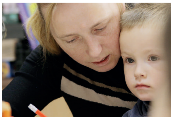
Rodzinne ciepło. Tylko ono może uczynić życie radosnym!

Jedną z wielu organizacji działających w Polsce na rzecz walki z problemem sieroctwa społecznego jest Stowarzyszenie SOS Wioski Dziecięce w Polsce. Organizacja prowadzi wioski dziecięce, wspólnoty młodzieżowe, a także świetlice dla rodziców i dzieci. Kładzie nacisk na budowanie relacji społecznych, integrowanie dzieci osieroconych ze społeczeństwem, a także na wsparcie dla rodzin zagrożonych wystąpieniem problemu. Odbudowuje więzi, których brak legł u podstaw dramatu wielu polskich kilku- lub kilkunastoletków.