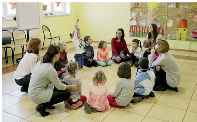
Zajęcia w świetlicy Stowarzyszenia SOS Wioski Dziecięce