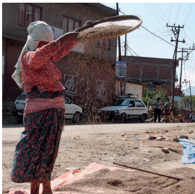
To kraj, w którym tradycja sąsiaduje niestety z biedą