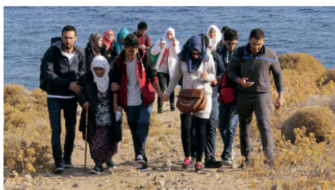
Pierwsze kroki na nowej, nieznannej ziemi. Dokąd zaprowadzą?