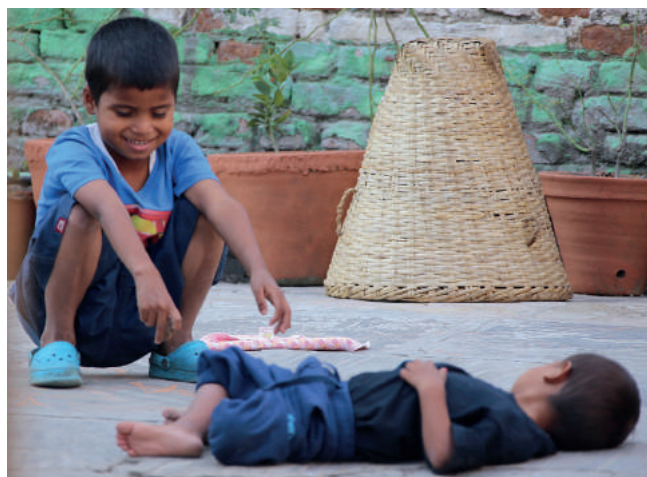
Błogie dzieciństwo... W Nepalu to często nieosiągalny luksus

Na rzecz dzieci przebywających w nepalskich więzieniach działają organizacje pomocowe, które próbują wypełnić pustkę tam, gdzie powinien istnieć społeczny system opieki. Znajdują się wśród nich m.in. PA Nepal (Prisoners Assistance Nepal) oraz Early Childhood Development Centre (ECDC). Zapewniają one dzieciom schronienie, wyżywienie i edukację. Uczą także nawiązywania zdrowych relacji społecznych, opartych na szacunku i zaufaniu. Pomagają małym podopiecznym „podnieść się” po doznanej traumie. Jednocześnie jednak przygotowują dzieci do ewentualnego powrotu do domu, ponieważ wiele z nich jest odbieranych przez rodziców po zakończeniu kary. Przygotowują też kobiety do wyjścia na wolność, oferując im różne programy wsparcia i nauki zawodu.