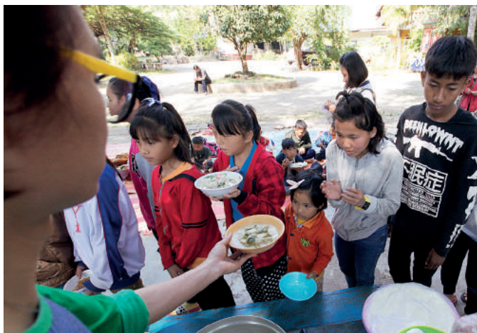
Wreszcie obiad! Codzienny! Nie ma już mowy o głodzie i strachu