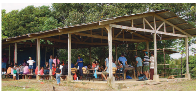
Gdy przybywają „Pływający Lekarze”, robi się wokół nich tłoczno