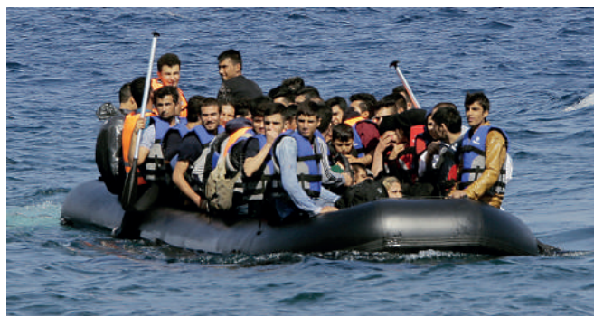
Łodzie nadziei - wypełnione uciekinierami wypatrującymi brzegu