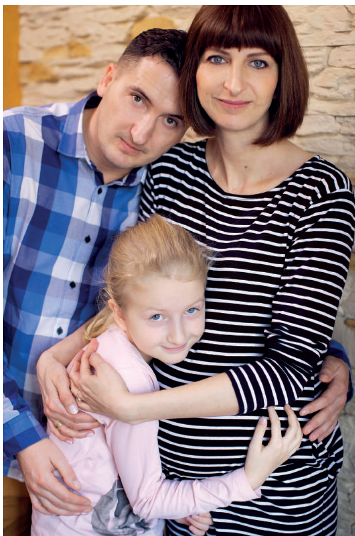
Rodzina w komplecie. Oczekująca na kogoś, kto niedługo się urodzi!

Pamiętajmy, że temat raka, a także współistnienia raka i ciąży jest dla Polski szczególnie istotny. Liczba zachorowań na nowotwory złośliwe w ciągu ostatnich trzech dekad wzrosła bowiem ponaddwukrotnie, przekraczając w 2013 roku liczbę 156 tysięcy zachorowań.