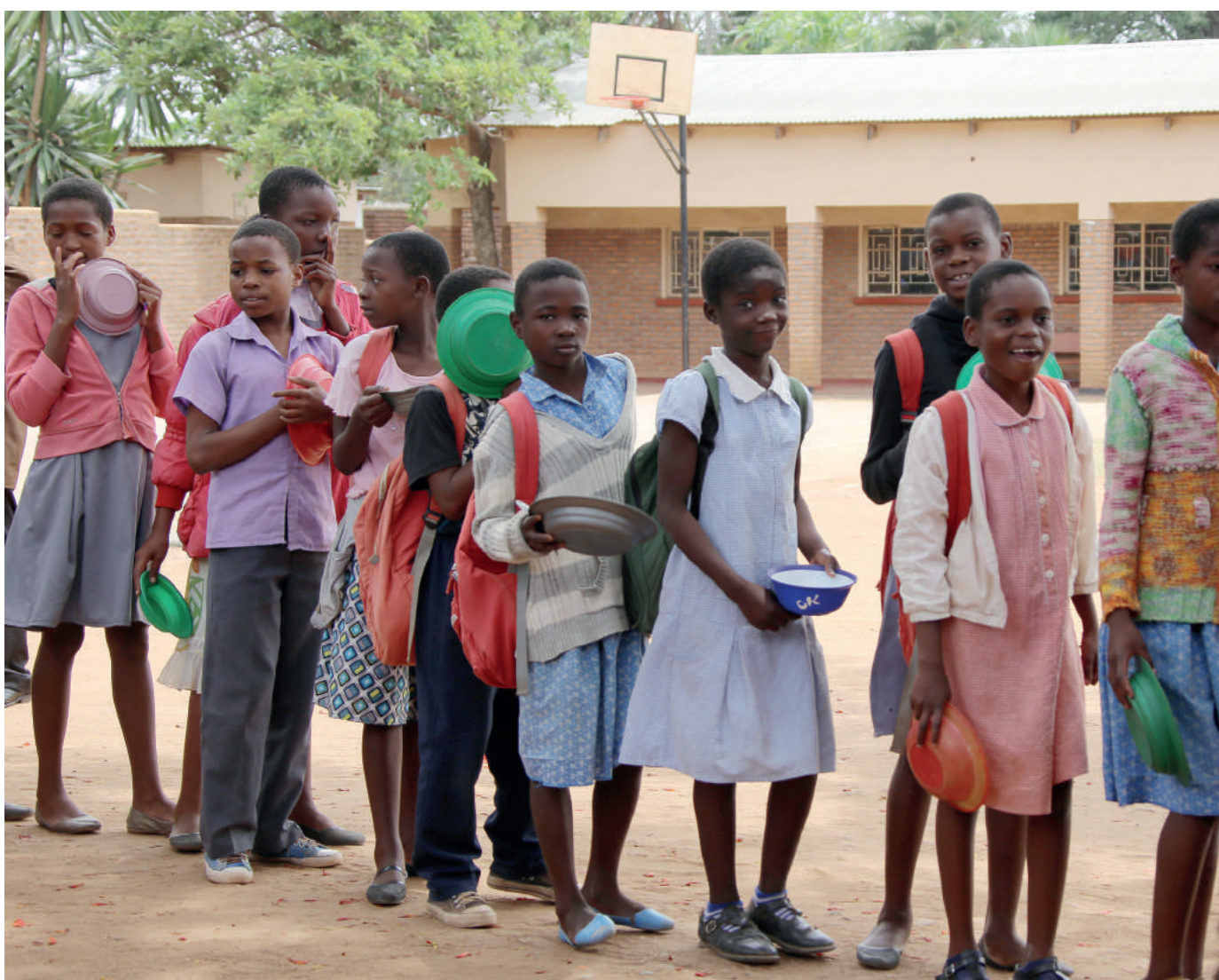
Nadzieja, radość, bezpieczeństwo. Kolejka po jedzenie w szkole prowadzonej przez Jacaranda Foundation