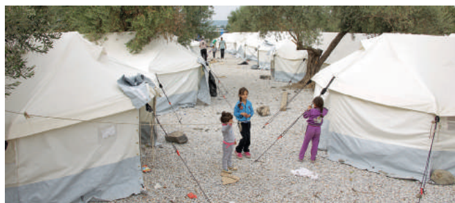
Obóz dla uciekinierów, którzy dopływają do brzegów Grecji