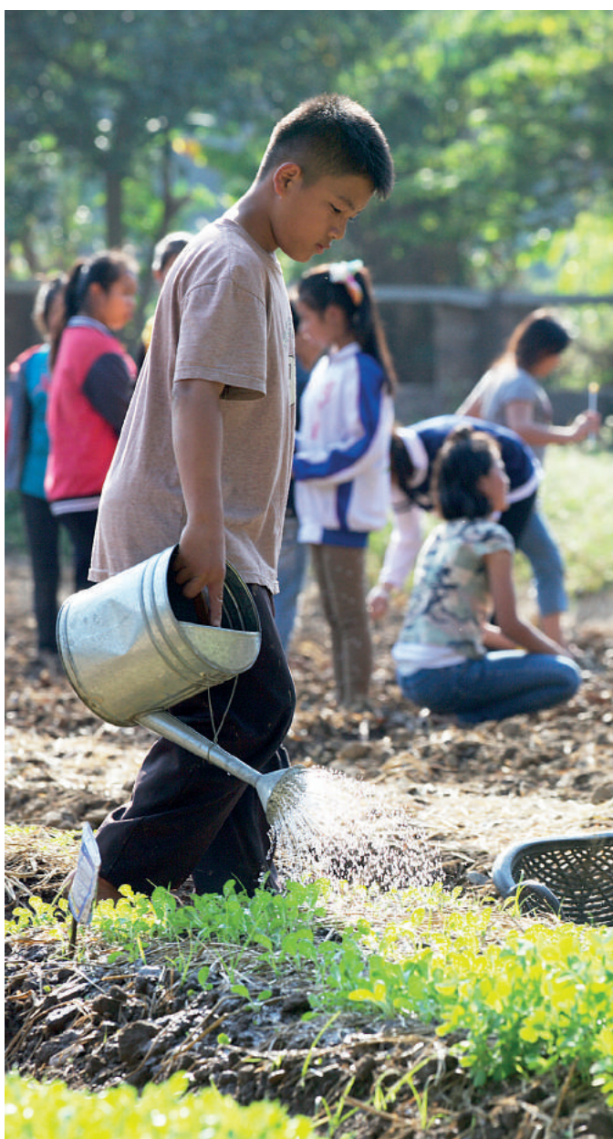
Podopieczni organizacji DEPDC uczą się w szkole zawodowej