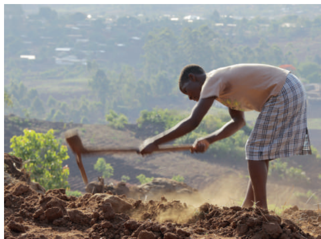
W Malawi wielu ludzi z trudem walczy o przetrwanie

Kiedy w tym kraju kobieta chora na AIDS rodzi zdrowe dziecko, staje przed okrutnym dylematem: czy karmić je piersią i ryzykować zarażenie, czy skazać je na śmierć głodową? W rezultacie, świadomie lub nie, wybiera opcję pierwszą. Szacuje się, że długość życia osób chorych na AIDS w Malawi nie przekracza 49 lat. Po pierwsze oznacza to, że dziecko zarażone HIV bardzo szybko straci rodziców i zostanie sierotą. Po drugie, straci także praktycznie wszystkie szanse na edukację – nie będzie miało bowiem opiekunów, którzy mu ją zapewnią i zostanie skazane na życie w skrajnej biedzie. Wziąwszy pod uwagę jego chorobę, oznacza to też ogromne cierpienie. Dlatego tak ważne są działania organizacji pomocowych takich jak Jacaranda Foundation, które starają się przejąć opiekę nad dziećmi pozostającymi w przerażającej sytuacji. Chodzi o to, by pomimo choroby miały prawo oraz warunki do rozwoju. By nie były skazane na walkę o życie na ulicy.