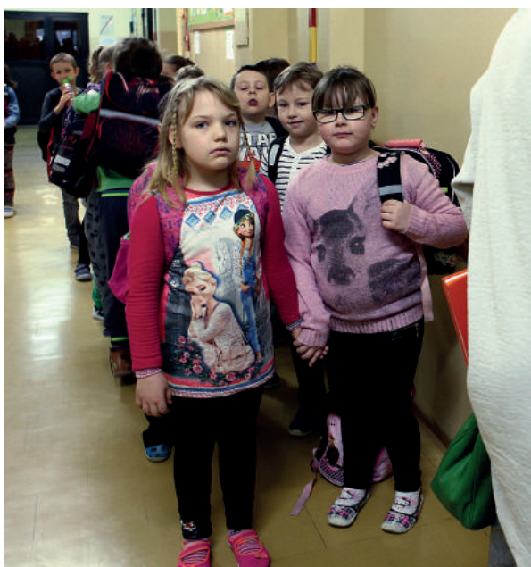
Mimo wojny robi się wszystko, by dzieci chodziły do szkoły

To ci, którzy odeszli walcząc o wolność. Zostawili dzieci, żony. Ich bliskim życie zawało się w jednej chwili