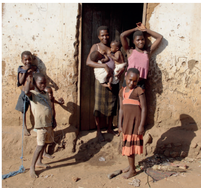
Niestety, wiele dzieci przychodzi tu na świat jako nosiciele HIV