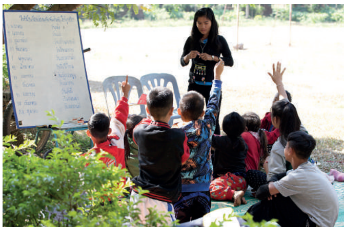
Szkoła DEPDC, czyli powrót do normalnego dzieciństwa...