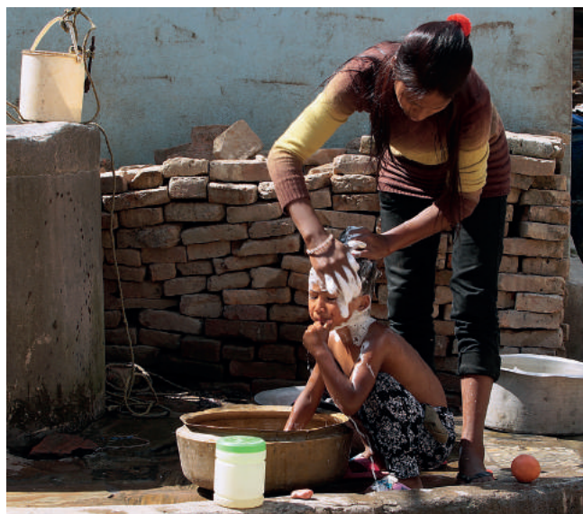
Rodzinne, pełne ciepła sytuacje. Niezależnie od warunków życia