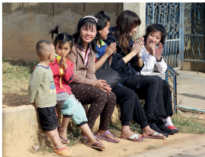
Spokój i radość! Potrzeba jak największej takich chwil