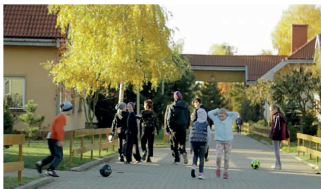
Nowa rodzina, nowi koledzy. I zabawa, której dotąd brakowało