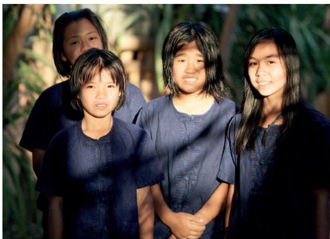
Tym dzieciom nic już nie grozi. Są pod opieką organizacji DEPDC