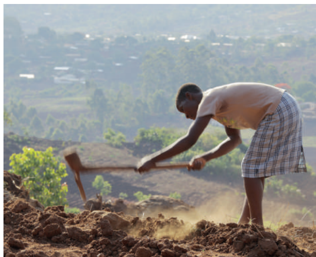
W Malawi wielu ludzi z trudem walczy o przetrwanie

Kiedy w tym kraju kobieta chora na AIDS rodzi zdrowe dziecko, staje przed okrutnym dylematem: czy karmić je piersią i ryzykować zarażenie, czy skazać je na śmierć głodową? W rezultacie, świadomie lub nie, wybiera opcję pierwszą. Szacuje się, że długość życia osób chorych na AIDS w Malawi nie przekracza 49 lat. Po pierwsze oznacza to, że dziecko zarażone HIV bardzo szybko straci rodziców i zostanie sierotą. Po drugie, straci także praktycznie wszystkie szanse na edukację – nie będzie miało bowiem opiekunów, którzy mu ją zapewnią i zostanie skazane na życie w skrajnej biedzie. Wziąwszy pod uwagę jego chorobę, oznacza to też ogromne cierpienie. Dlatego tak ważne są działania organizacji pomocowych takich jak Jacaranda Foundation, które starają się przejąć opiekę nad dziećmi pozostającymi w przerażającej sytuacji. Chodzi o to, by pomimo choroby miały prawo oraz warunki do rozwoju. By nie były skazane na walkę o życie na ulicy.