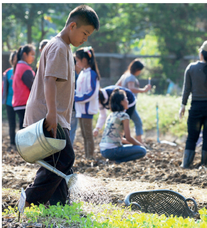
Podopieczni organizacji DEPDC uczą się w szkole zawodowej