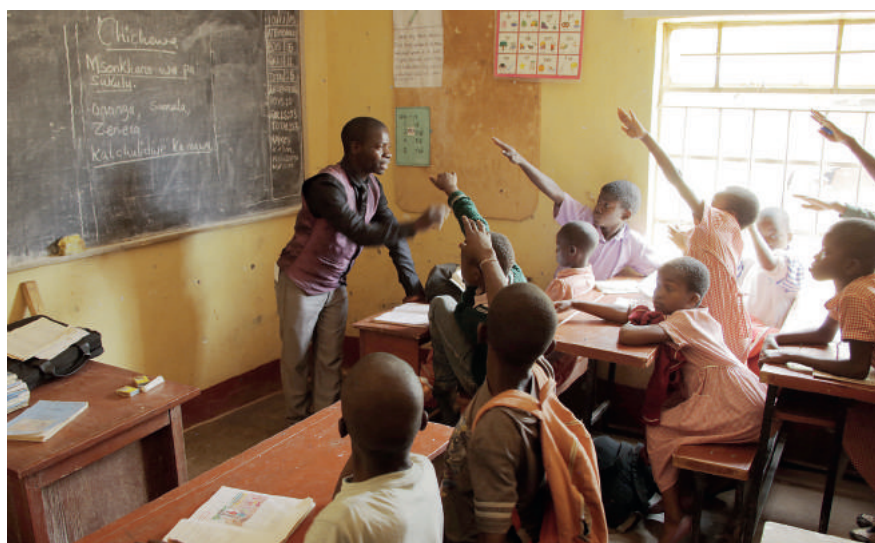
Szkoła prowadzona przez Fundację Jacaranda. Wiele z tych dzieci żyło dotąd na ulicy!