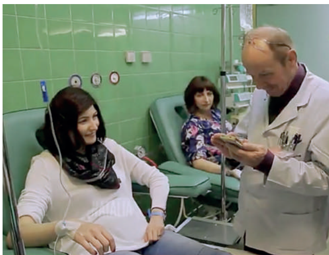
Rak i oczekiwanie na nowe życie. Te kobiety udowadniają, że jedno nie przeczy drugiemu!