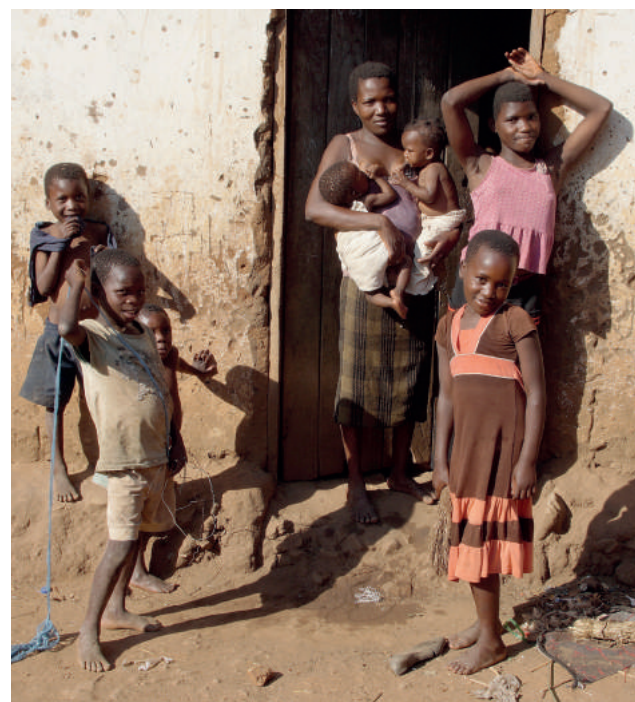
Niestety, wiele dzieci przychodzi tu na świat jako nosiciele HIV