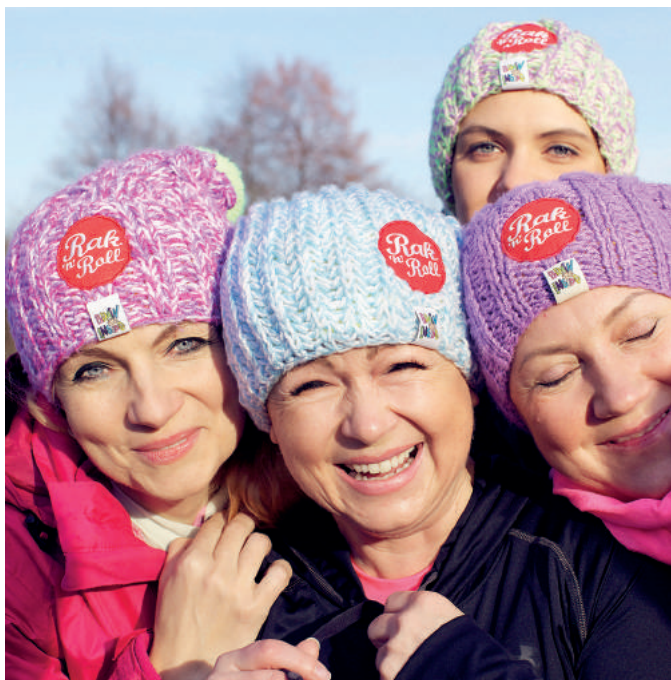
Uśmiech, sport, szalone pomysły. To Fundacja Rak'n'Roll!