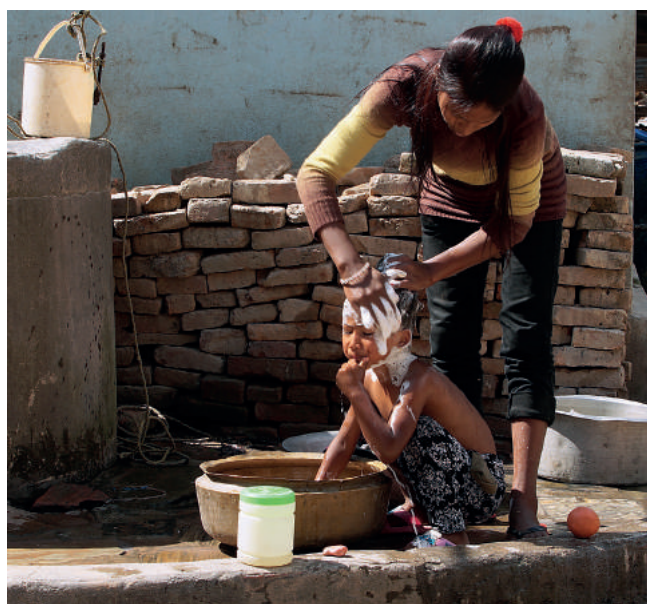
Rodzinne, pełne ciepła sytuacje. Niezależnie od warunków życia