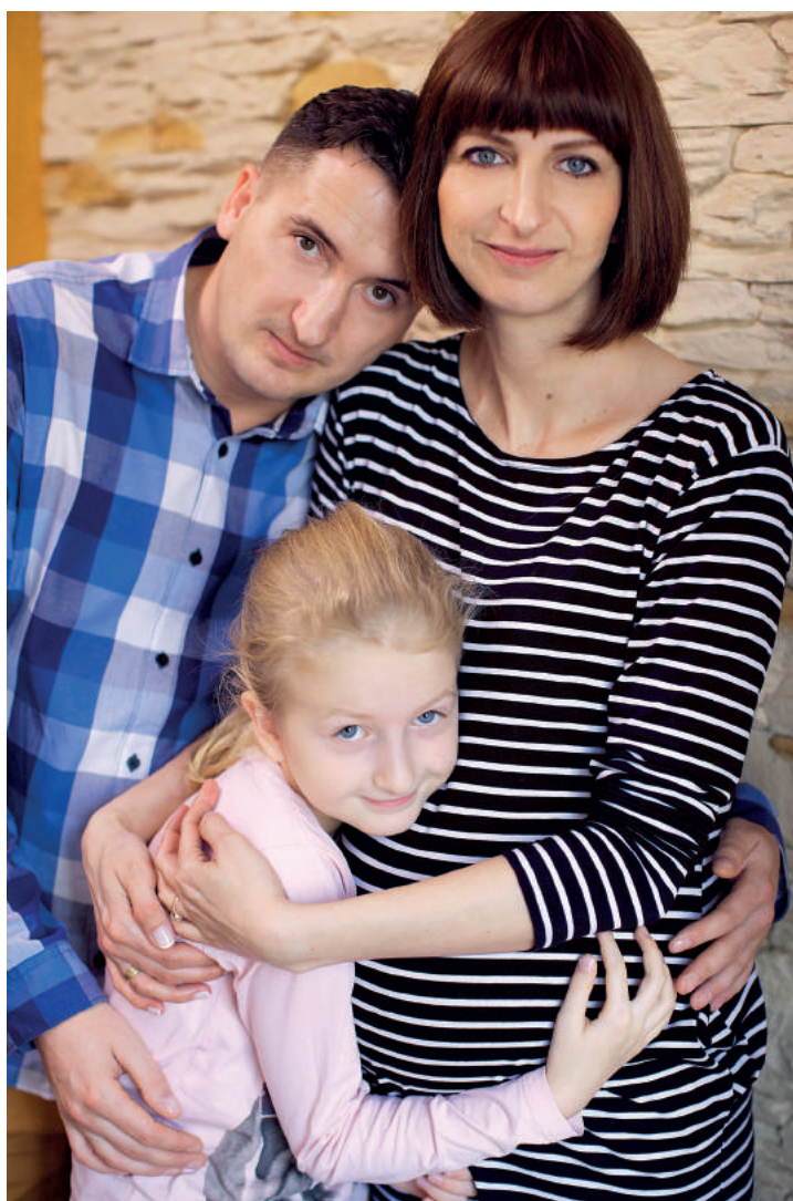
Rodzina w komplecie. Oczekująca na kogoś, kto niedługo się urodzi!

Pamiętajmy, że temat raka, a także współistnienia raka i ciąży jest dla Polski szczególnie istotny. Liczba zachorowań na nowotwory złośliwe w ciągu ostatnich trzech dekad wzrosła bowiem ponaddwukrotnie, przekraczając w 2013 roku liczbę 156 tysięcy zachorowań.