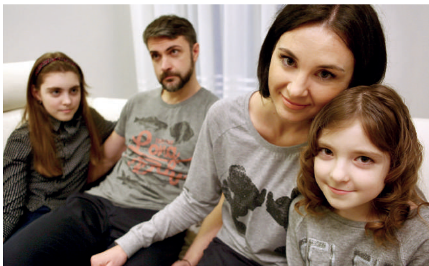
Rodzina Wasilewskich pochodzi z obwodu donieckiego. Znalazła schronienie w Polsce