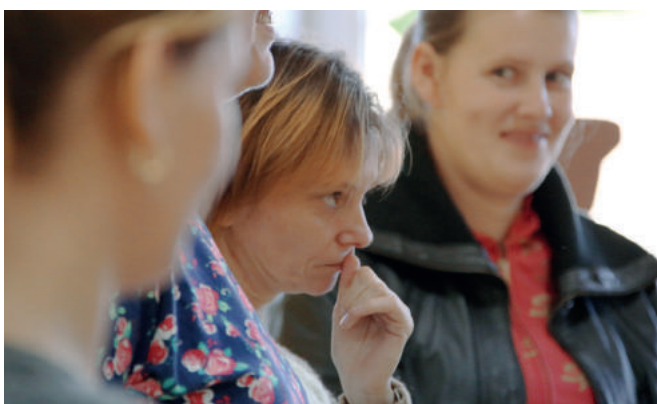
Stowarzyszenie SOS Wioski Dziecięce uczy, jak pomagać dzieciom