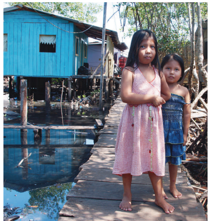
... a jednocześnie nie tak daleko biedne, drewniane zabudowania