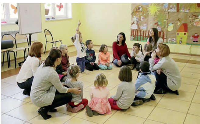
Zajęcia w świetlicy Stowarzyszenia SOS Wioski Dziecięce