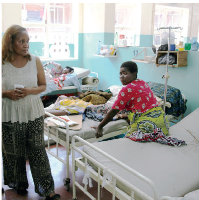
Tak wygląda szpital, w którym leżą m.in. ludzie chorzy na AIDS