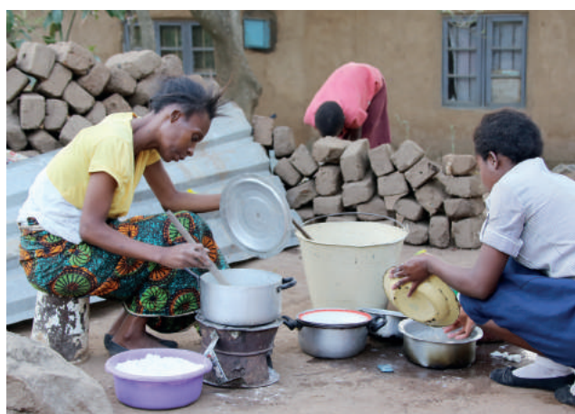
Obiad to w zmagającym się z biedą Malawi ważne wydarzenie