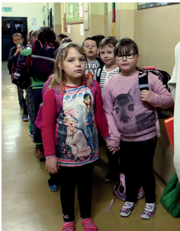
Pomimo wojny ważne jest, by dzieci chodziły do szkoły

To ci, którzy odeszli walcząc o wolność. Zostawili dzieci, żony. Ich bliskim życie zaważyło się w jednej chwili