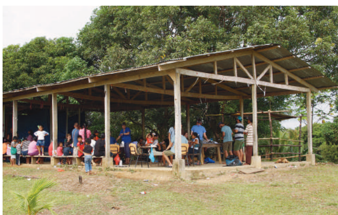
Gdy przybywają „Pływający Lekarze”, robi się wokół nich tłoczno