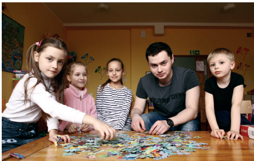
Wreszcie normalne życie. Bez wybuchów, bez strachu. Z dala od strefy wojny