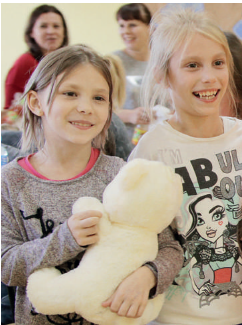
Rodzinne ciepło. Tylko ono może uczynić życie radosnym! Stowarzyszenie SOS Wioski Dziecięce robi wszystko, by dzieci były szczęśliwe