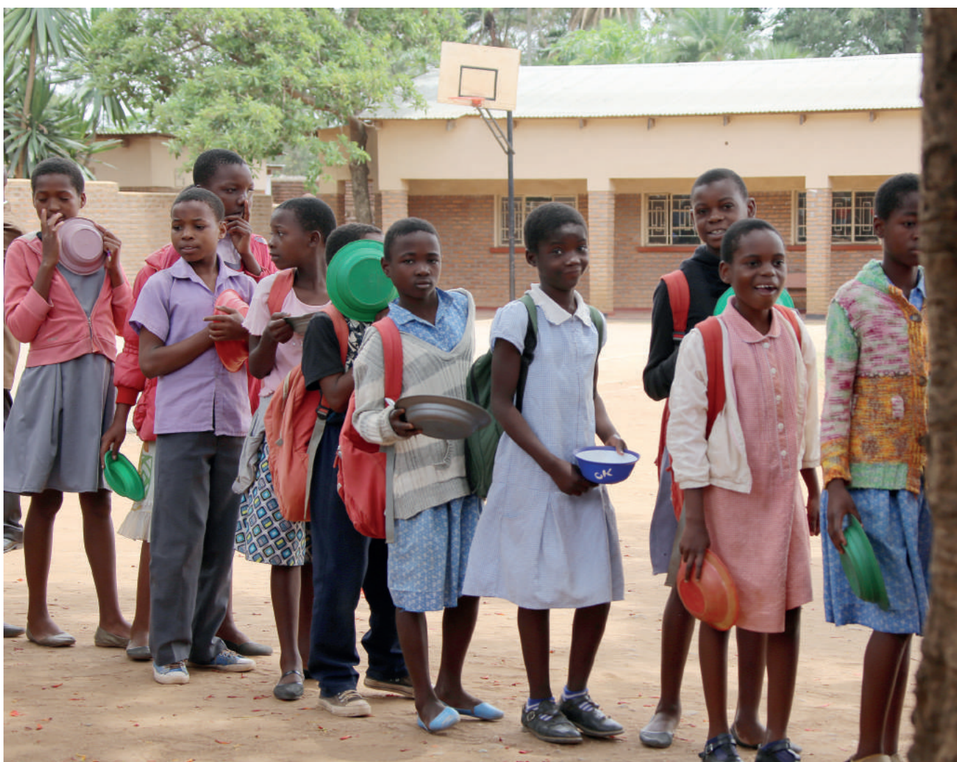
Nadzieja, radość, bezpieczeństwo. Kolejka po jedzenie w szkole prowadzonej przez Jacaranda Foundation