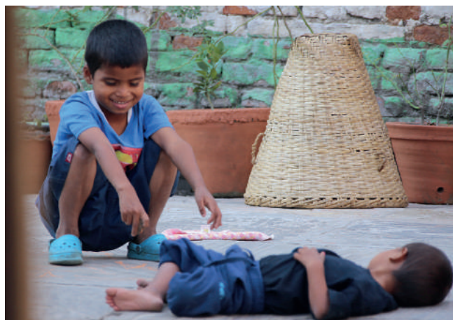
Błogie dzieciństwo... W Nepalu to często nieosiągalny luksus

Na rzecz dzieci przebywających w nepalskich więzieniach działają organizacje pomocowe, które próbują wypełnić pustkę tam, gdzie powinien istnieć społeczny system opieki. Znajdują się wśród nich m.in. PA Nepal (Prisoner Assistance Nepal) oraz Early Childhood Development Centre (ECDC). Zapewniają one dzieciom schronienie, wyżywienie i edukację. Uczą także nawiązywania zdrowych relacji społecznych, opartych na szacunku i zaufaniu. Pomagają małym podopiecznym „podnieść się” po doznanej traumie. Jednocześnie jednak przygotowują dzieci do ewentualnego powrotu do domu, ponieważ wiele z nich jest odbieranych przez rodziców po zakończeniu kary. Przygotowują też kobiety do wyjścia na wolność, oferując im różne programy wsparcia i nauki zawodu.