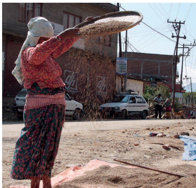
To kraj, w którym tradycja często łączy się niestety z biedą