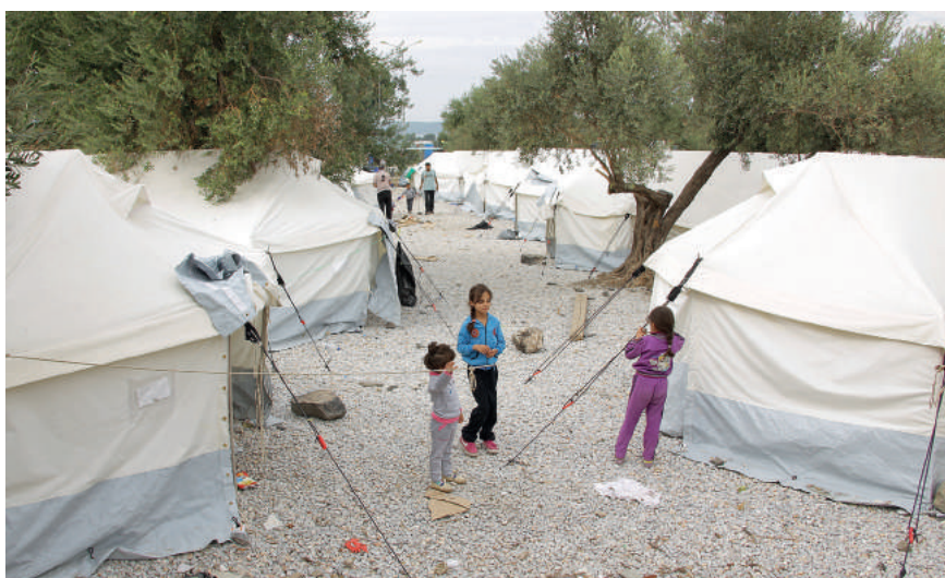
Obóz dla uchodźców, którzy dopływają do brzegów Grecji