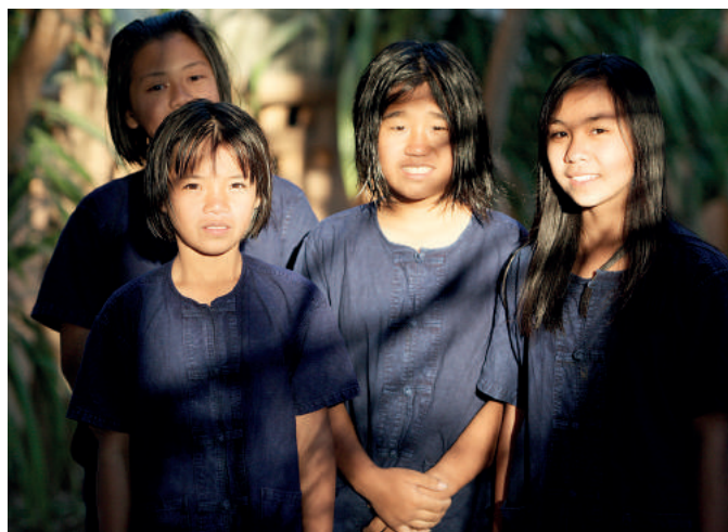
Tym dzieciom nic już nie grozi. Są pod opieką organizacji DEPDC

Oficjalne uregulowania prawne Tajlandii uznają wprawdzie prostytucję za nielegalną, jednocześnie jednak sektor ten w znaczącym stopniu zwiększa dochody z turystyki, co sprawia, że władze kraju zajmują bierną pozycję wobec tego procederu. Niezwykle istotne stają się więc inicjatywy pozarządowe ukierunkowane na walkę z różnymi formami współczesnego niewolnictwa. Jedną z takich organizacji jest Development and Education Programme for Daughters and Communities. Organizacja prowadzi szkołę zawodową oraz schronisko dla dzieci.