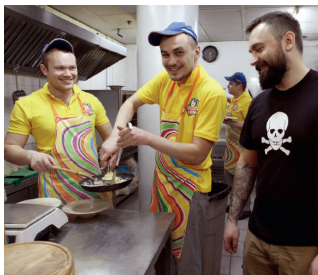
Pizza Veterano pomaga weteranom zapomnieć o wojnie