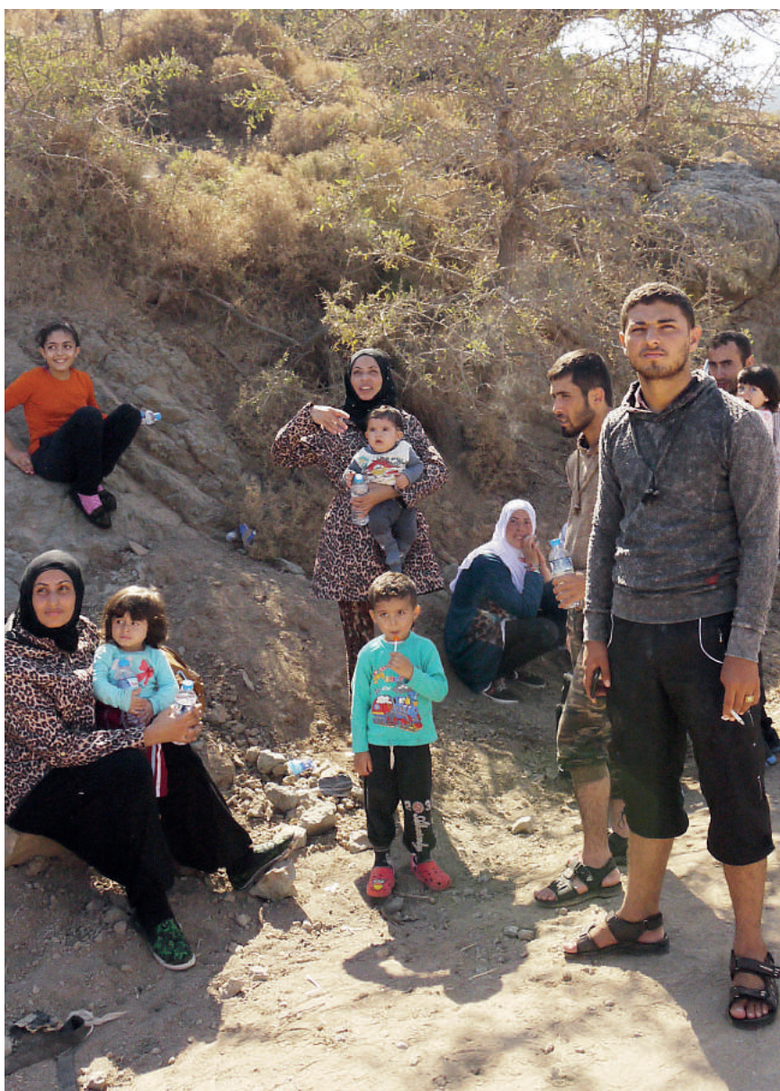
Do Grecji przybywają całe rodziny uchodźców. Zostawiają wszystko, by przeżyć