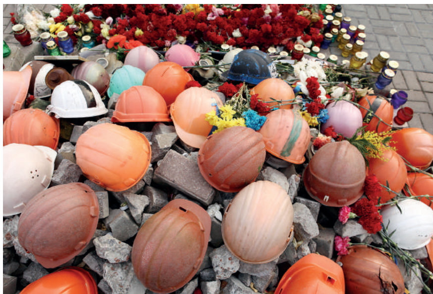
Ukraiński Majdan. Te symbole przypominają, jak zacięte walki tu trwały