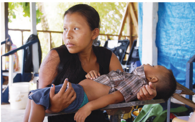
Dramatyczny widok, ale na szczęście obok są lekarze-wolontariusze