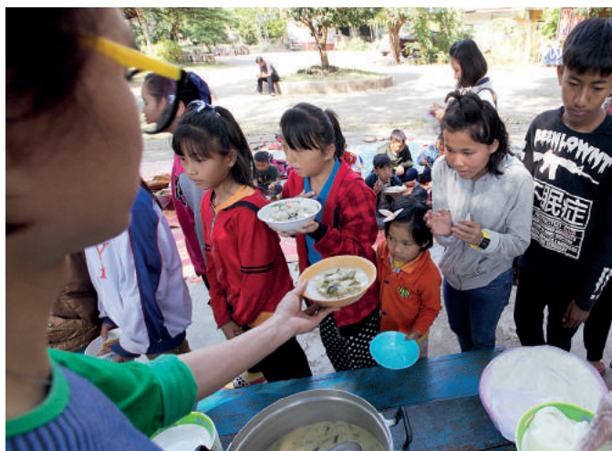
Wreszcie obiad! Codzienny! Nie ma już mowy o głodzie i strachu