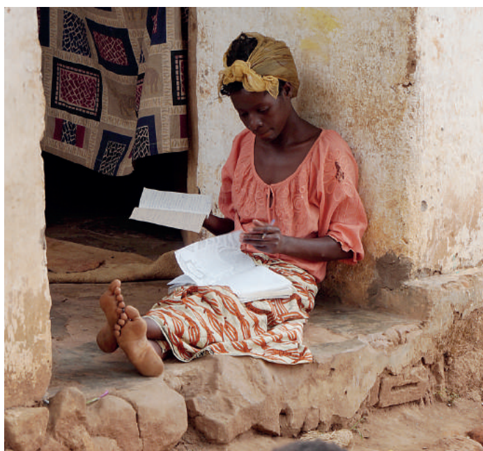
W Malawi edukacja jest szansą na zmianę warunków życia