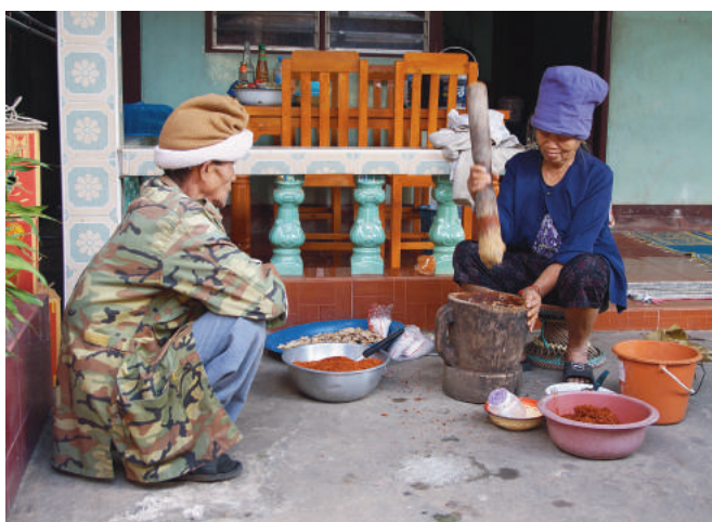
Tradycyjna Panama. Ci ludzie muszą mieć dostęp do lekarza!