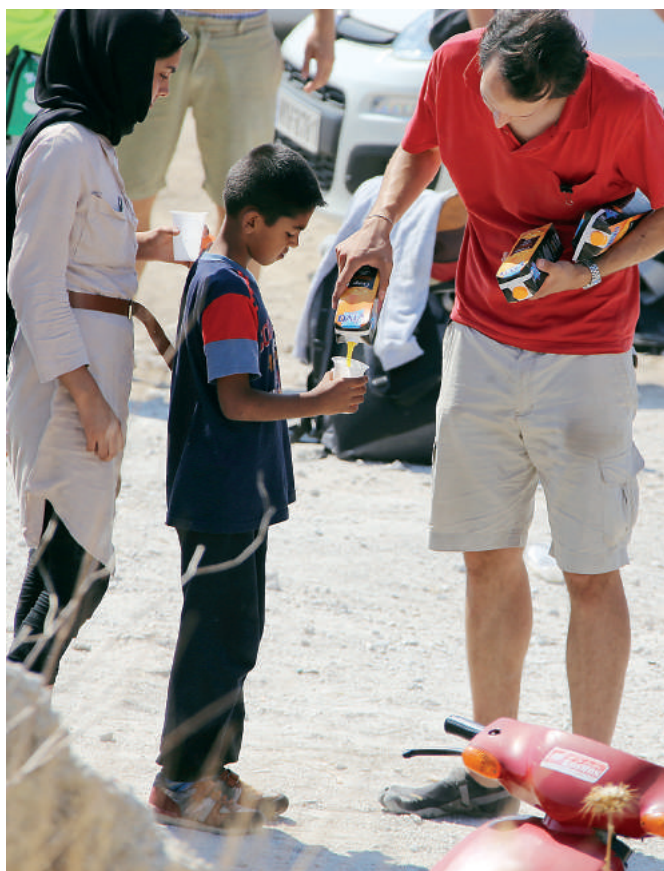
Na brzegu czeka pomoc: pomoc medyczna, jedzenie i picie