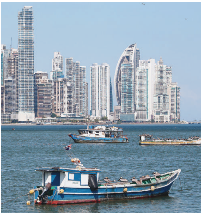
Kontrasty. Nowoczesne, bogate miasto z drapaczami chmur...