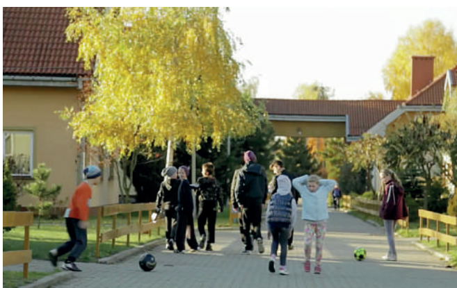
Nowa rodzina, nowi koledzy. I zabawa, której dotąd brakowało